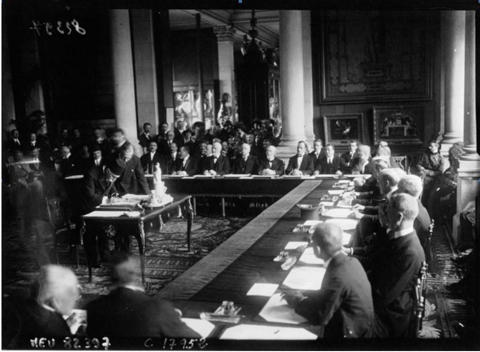
Türk delegasyonu Sevr Barış Antlaşmasının altına imza atıyor