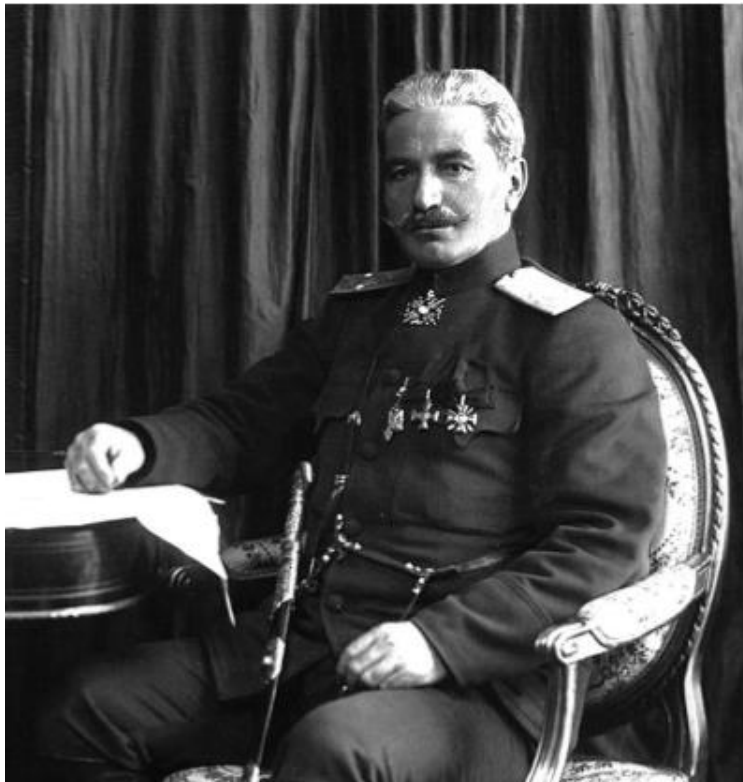
Antranik Paşa (General)