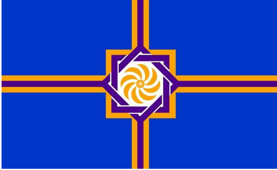
Batı Ermenistan Cumhuriyeti'nin (Ermenistan) Bayrađı