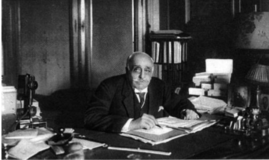
ԳՕՂՈՍ ՆՈՒԲԱՐ ՓԱՇԱ ԱՅԳԱՅԻՆ ԲԱՐԵՐԱՐ ԵՒ ՀՈՒՆԱԴԻՐ Հ. Բ. Շ. ՍԻՈՒՅԱՆ