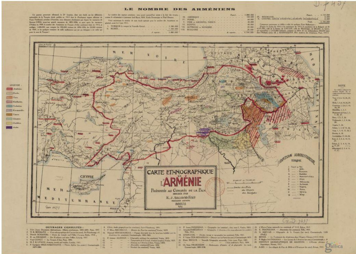
Ermenistan'ın etnografik haritası