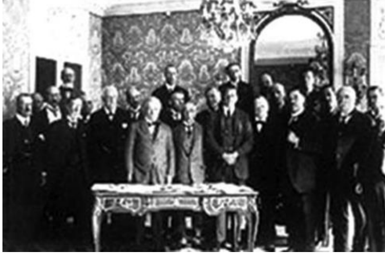
Sevr Barış Antlaşmasının katılımcıları